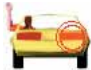
Ручной сигнал поворота направо