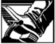
ब्रेक पैडल पर पैर रखें