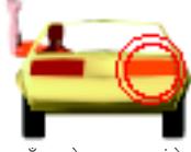
दाएँ मुड़ने का हाथ संकेत