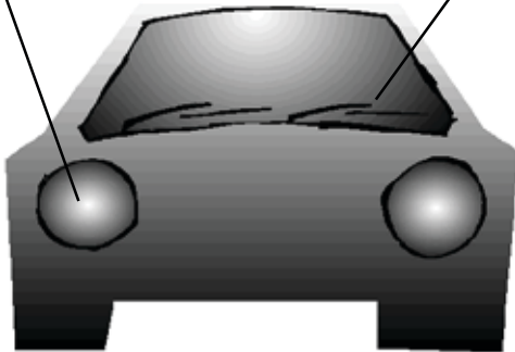
(ウィンドシールド) ワイパー