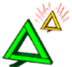
Pisca-piscas de emergência