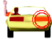
Sinal de mão para virar à direita