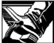
Pise el pedal del freno