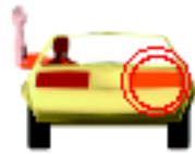
Señal de brazo para dar vuelta a la derecha